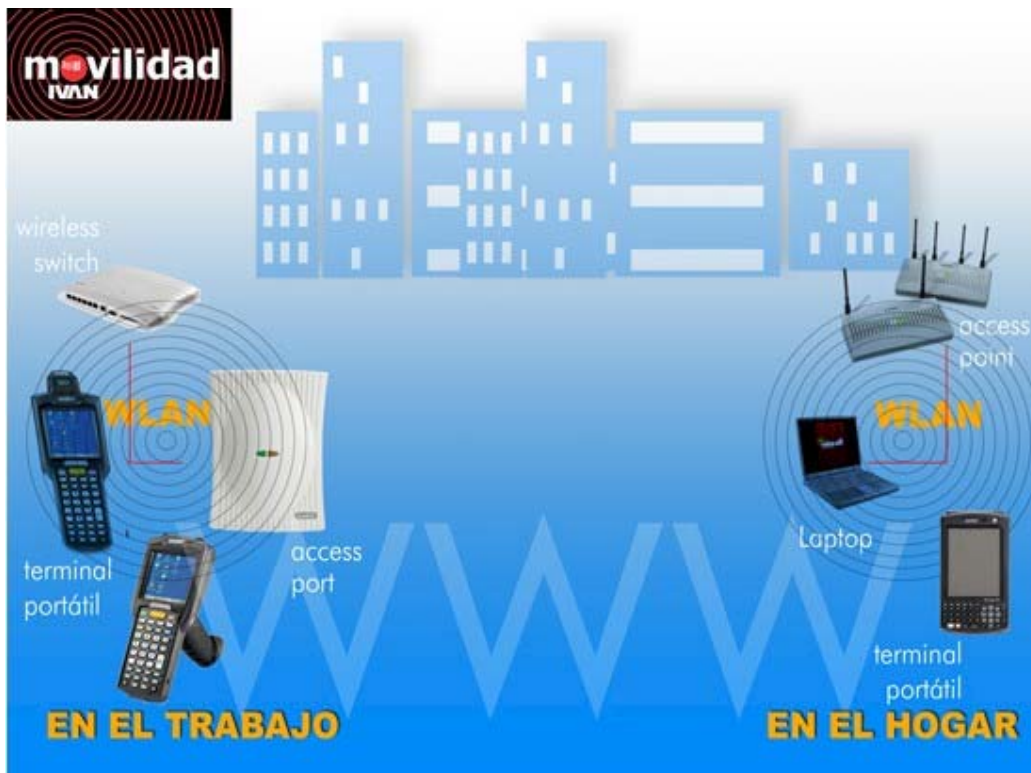
Figura 2. Movilidad ininterrumpida, EN EL TRABAJO Y EN EL HOGAR

¿Qué se requiere para dar movilidad ininterrumpida en áreas cerradas ó en Interiores como son el caso del trabajo, las bodegas y almacenes, hospitales y en el hogar?