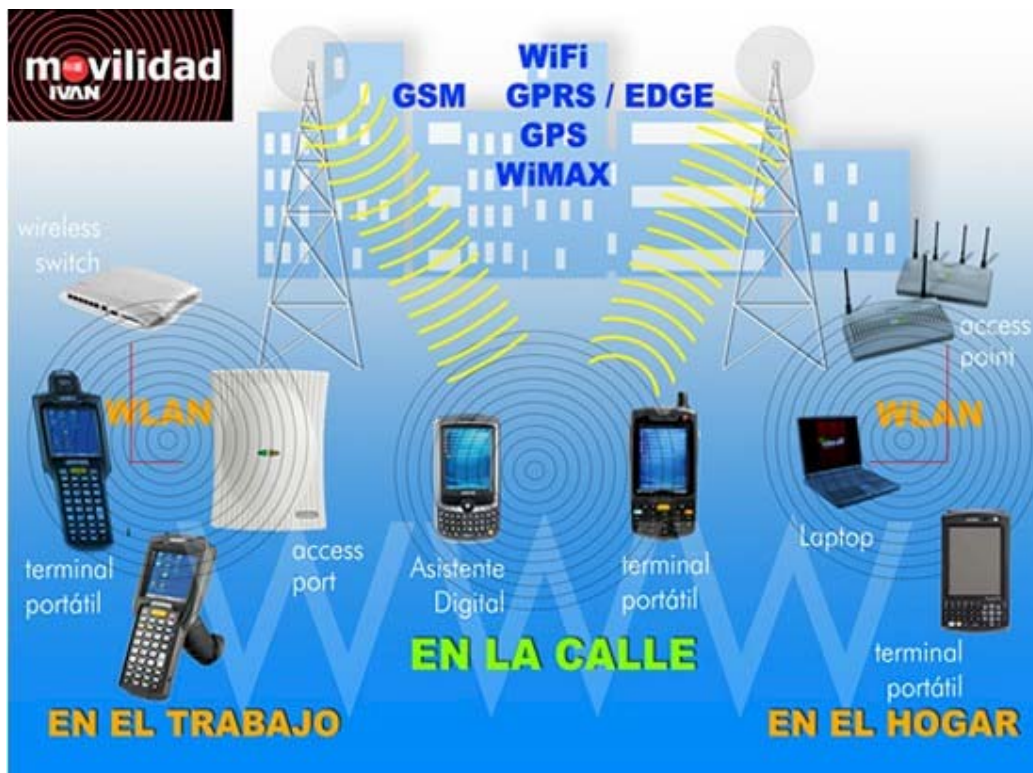
Figura 1. Movilidad ininterrumpida, EN CUALQUIER LUGAR Y EN CUALQUIER MOMENTO

El estandarizar el acceso a los recursos de información de la empresa redonda en un menor tiempo de entrenamiento y capacitación de los usuarios, ya que la forma de comunicarse con los sistemas de la empresa es transparente y siempre será la misma apariencia sin importar el tipo de dispositivo que se utilice.